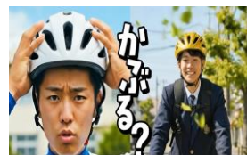
ヘルメット着用編

また、三重県警察ホームページでは、本資料のほか、自転車の交通反則通告制度等に関する情報を掲載していますので、ご一読ください。