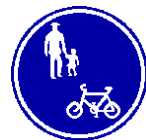
普通自転車歩道通行可の標識

★歩道を通行できる場合は、歩道の中央から車道寄りの部分を すぐに停止できる速度 で通行しなければいけません。