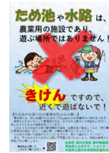
チラシの配布（青森県）