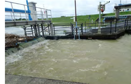
農業用の用排水路の増水状況

ため池の転落死亡事故は、釣り、水遊び等を行っているときに発生することが多くなっています。