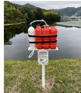
レスキューペットボトル設置